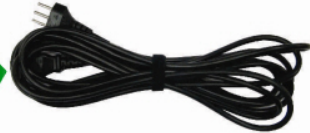
Cabo de Força